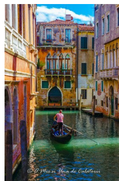
Figura 1.2 Veneția – Italia