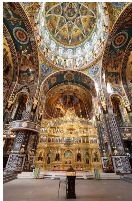
Catedrala Arhiepiscopală Ortodoxă din Arad. În imaginea din partea stângă: vedere exterioară a catedralei, iar în imaginea din partea dreaptă este o secțiune a interiorului acesteia.