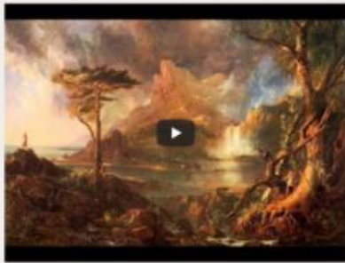
"Moartea lui Ase" - Suita nr. 1, op. 46