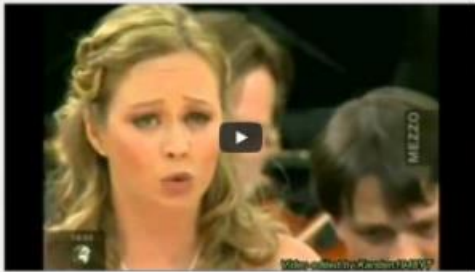
"Cântecul lui Solveig" - Suita nr. 2, op. 55