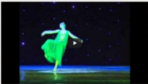
"Dansul Anitrei" - Suita nr. 1, op. 46