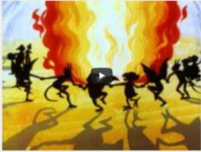
"În peștera regelui munților" - Suita nr. 1, op. 46